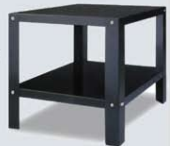
TABLE PIZZA Dimensions: 1300x785x850 cm